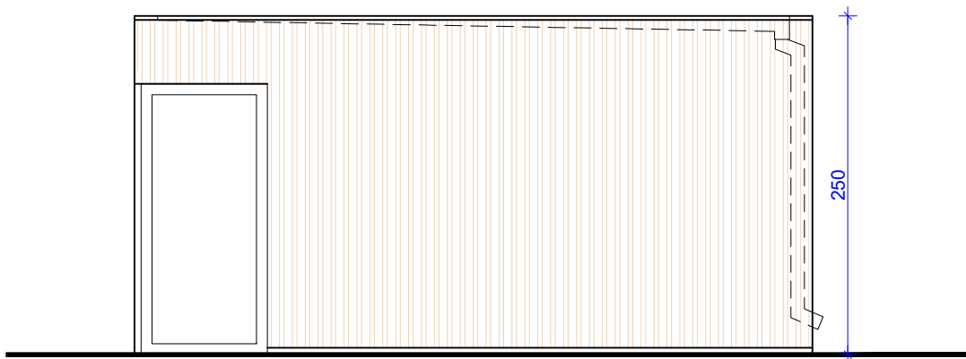
ELEWACJA POŁUDNIOWO WSCHODNIA BUDYNKU GOSPODARCZEGO "A"